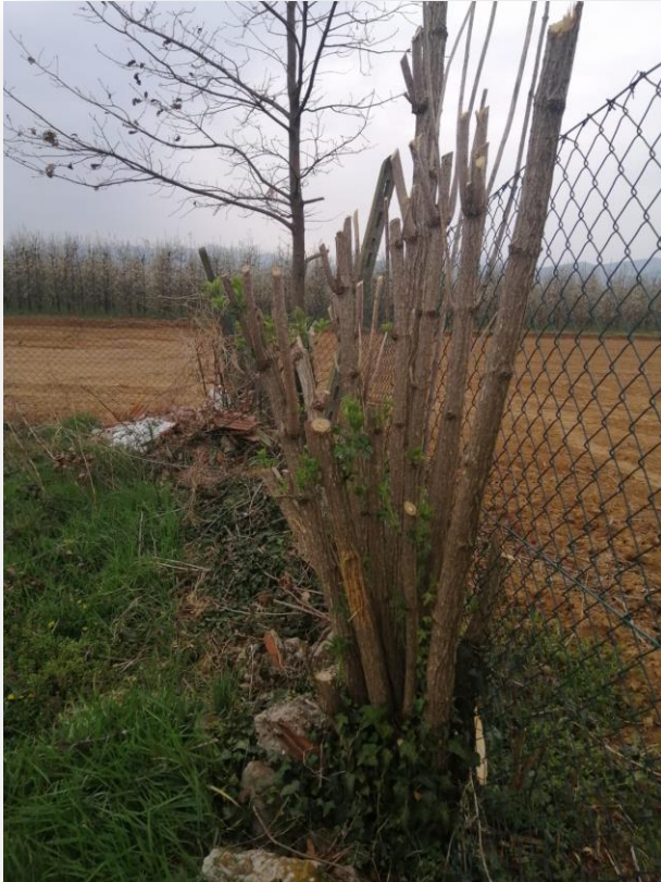
Immagine scattata il 25/03/2020

La mia idea è quella di realizzare un portapenne con i rami di sambuco. Come mai ho scelto proprio questa pianta? Semplice! All'interno dei rami passa un midollo facilmente estraibile che lascerà il ramo libero nel suo interno. A quel punto, il ramo di sambuco assumerà una forma cilindrica ove inserire penne e matite.