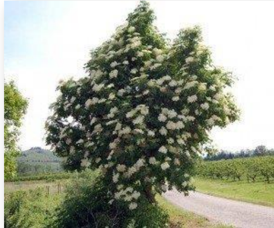
Immagine presa da internet